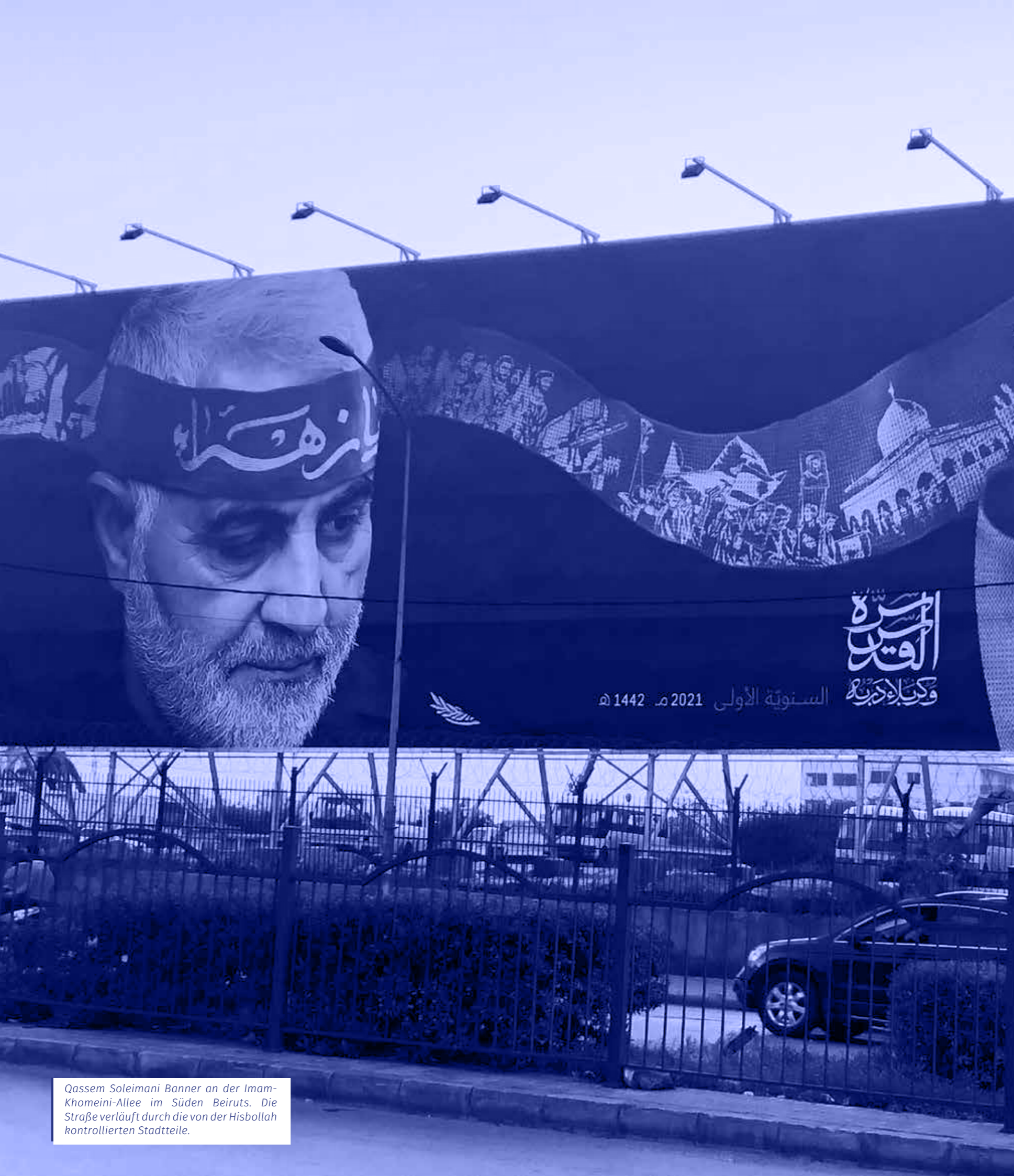
Qassem Soleimani Banner an der Imam-Khomeini-Allee im Süden Beiruts. Die Straße verläuft durch die von der Hisbollah kontrollierten Stadtteile.