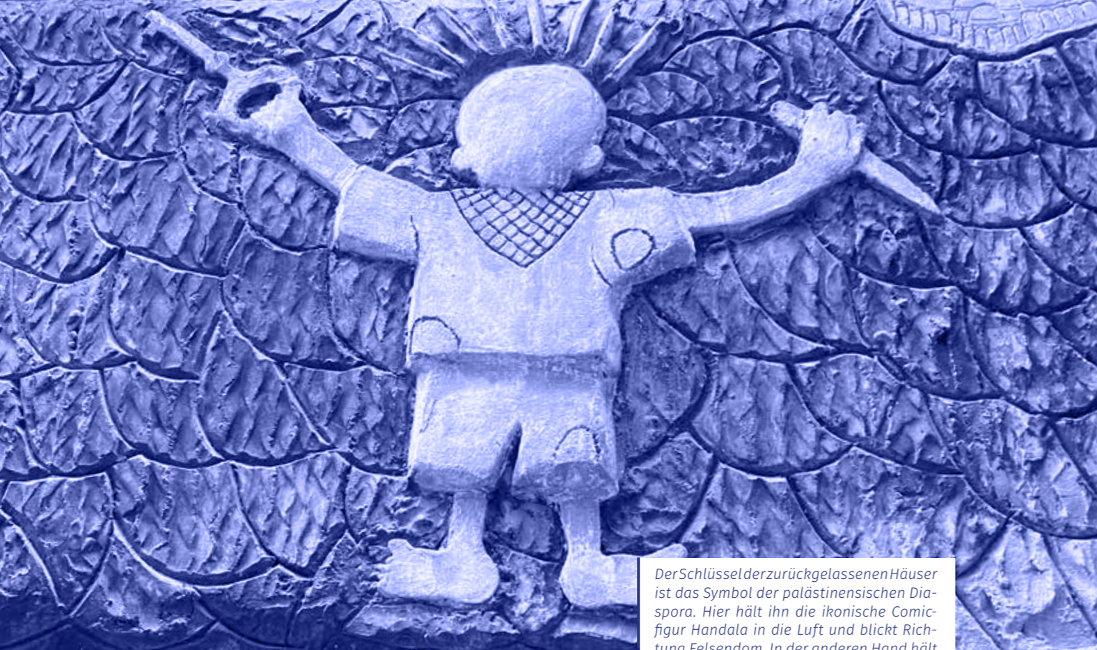
Der Schlüssel der zurückgelassenen Häuser ist das Symbol der palästinensischen Diaspora. Hier hält ihn die ikonische Comicfigur Handala in die Luft und blickt Richtung Felsendom. In der anderen Hand hält sie ein Messer.

Zuvor lebten sie in einem Dorf bei Safed.