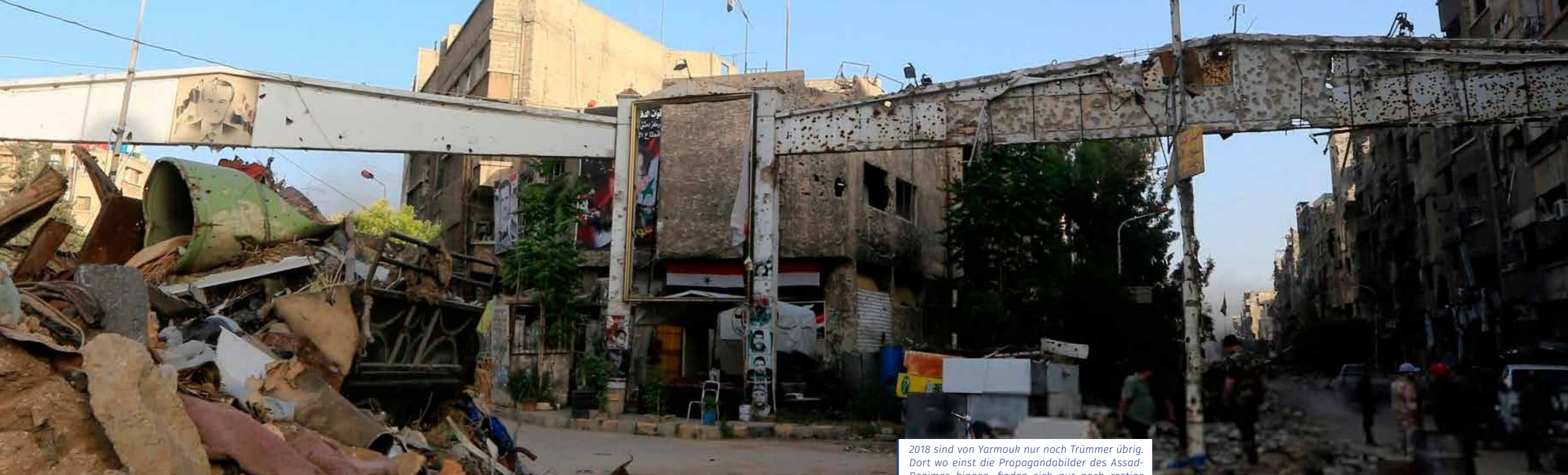
2018 sind von Yarmouk nur noch Trümmer übrig. Dort wo einst die Propagandabilder des Assad-Regimes hingen, finden sich nur noch rostige Einschusslöcher.

abgeriegelt. Die UNRWA konnte unter diesen Bedingungen die Notunterstützung nicht mehr gewährleisten. Abgeschnitten von Nahrungsmitteln, Wasser, Strom und medizinischer Versorgung, starben viele den Hungertod. Andere wurden durch die Bombardements und die Heckenschützen der Achse des Widerstands ermordet – den selbsterklärten Beschützern der Palästinenser! Aufgrund von Al-Yarmouks strategischer Nähe zur damaszener Innenstadt waren die Kämpfe hier besonders hart. Die Zerstörung ist unvorstellbar. Nach Jahren der Aushungerungspolitik, brutalen Kriegsverbrechen, einem Überfall der Terrororganisation Islamischer Staat und der erneuten Übernahme durch das syrische Regime, ist von den ursprünglichen Bewohnern praktisch niemand übriggeblieben. Einige leben heute in anderen Teilen von Damaskus, viele fanden Zuflucht im Libanon oder in Jordanien, andere flohen nach Europa – einer davon bin ich.