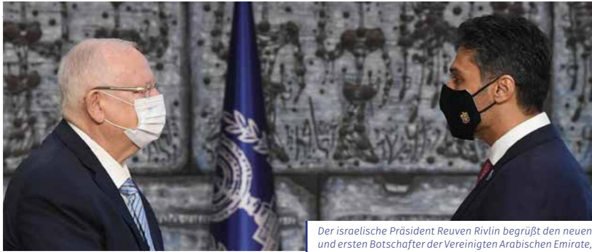
Der israelische Präsident Reuven Rivlin begrüßt den neuen und ersten Botschafter der Vereinigten Arabischen Emirate, Mohamed Al Khaja. Zahlreiche andere arabische Staaten haben ihre Beziehungen zu Israel normalisiert.

Rahmen der sogenannten Abraham Accords seit September 2020 kontinuierlich verbessert. Das hat gewichtige und erfreuliche Folgen: So reformiert Saudi-Arabien etwa sein Schulcurriculum und entfernt antiisraelische Inhalte aus seinem Lehrmaterial. Politiker aus den Vereinigten Arabischen Emiraten fordern, die Vermittlung der Shoah zum Thema in arabischen Schulcurricula zu machen. 4