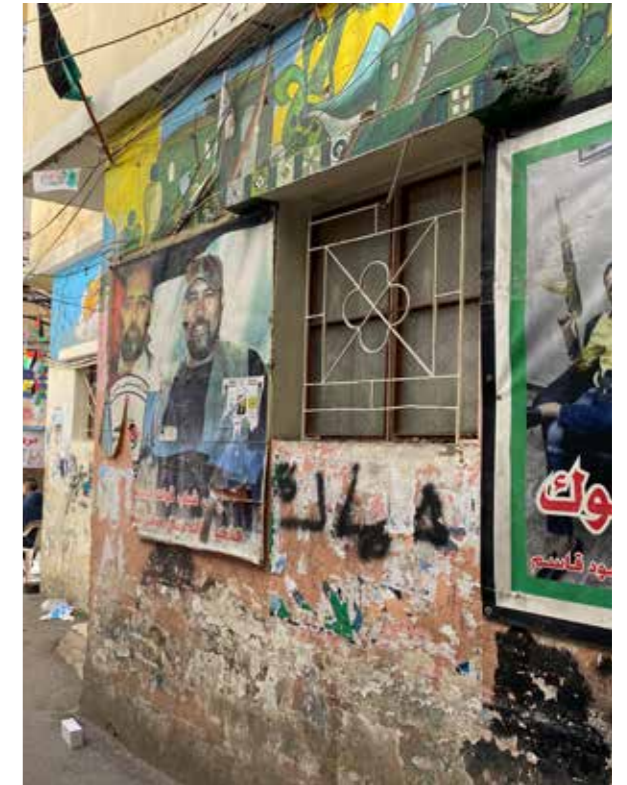
Plakate und Graffiti erinnern an die sogenannten Šuhadā , die Märtyrer.

Die Mehrheit der Diasporapalästinenser ist heute frustriert und misstraut der eigenen Führung. Sie gilt ihnen als hochgradig korrupt und unfähig. Die Palästinenserparteien beharren zwar weiterhin auf dem Rückkehrrecht , doch die Nachkommen der zweiten und dritten Generation glauben bereits nicht mehr daran. Obwohl Schlüssel an Hausfassaden und Schulbücher sie an die Heimat der Vorfäter gemahnen, sind ihre Erinnerungen verwischt. Teils stehen sie einer Rückkehr gleichgültig gegenüber. Vergessen haben sie die palästinensische Heimat allerdings nicht. Dazu tragen nicht zuletzt ihr bis heute ungeklärter Status und die krasse Diskriminierung bei, die sie nicht nur im Libanon erfahren. Trotzdem möchten die meisten lieber in ein Drittland emigrieren als nach Palästina zurückzukehren. Denn vor allem wollen sie möglichst bald eine Zukunftsperspektive. Die Kluft zwischen ihnen und der Palästinenserführung könnte kaum tiefer sein.