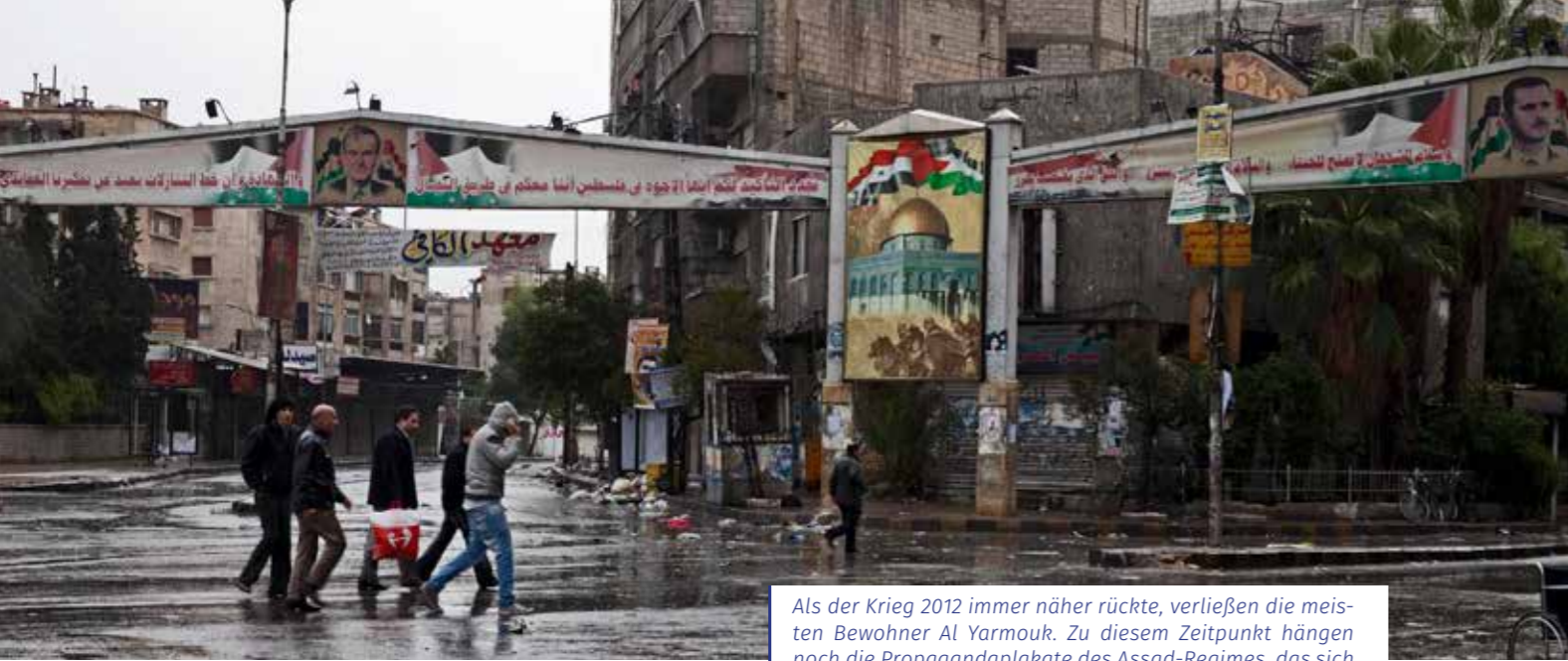
Als der Krieg 2012 immer näher rückte, verließen die meisten Bewohner Al Yarmouk. Zu diesem Zeitpunkt hängen noch die Propagandaplakate des Assad-Regimes, das sich als Beschützer der Palästinenser inszeniert.

anderen Land liegen, das ihnen gestohlen und von dem sie vertrieben wurden. So durchquerten sie auf dem Weg zur Schule Straßen, die Namen von palästinensischen bzw. israelischen Städten trugen, in denen die Wände mit Graffiti und Plakaten übersät waren, von denen einige an die Märtyrer erinnerten, die sich für die palästinensische Sache geopfert haben und in denen viele Läden nationale oder anti-imperialistische Symbole wie die Kufiya, 1 Comics der Handala-Figur 2 oder Bilder von Che Guevara verkauften.