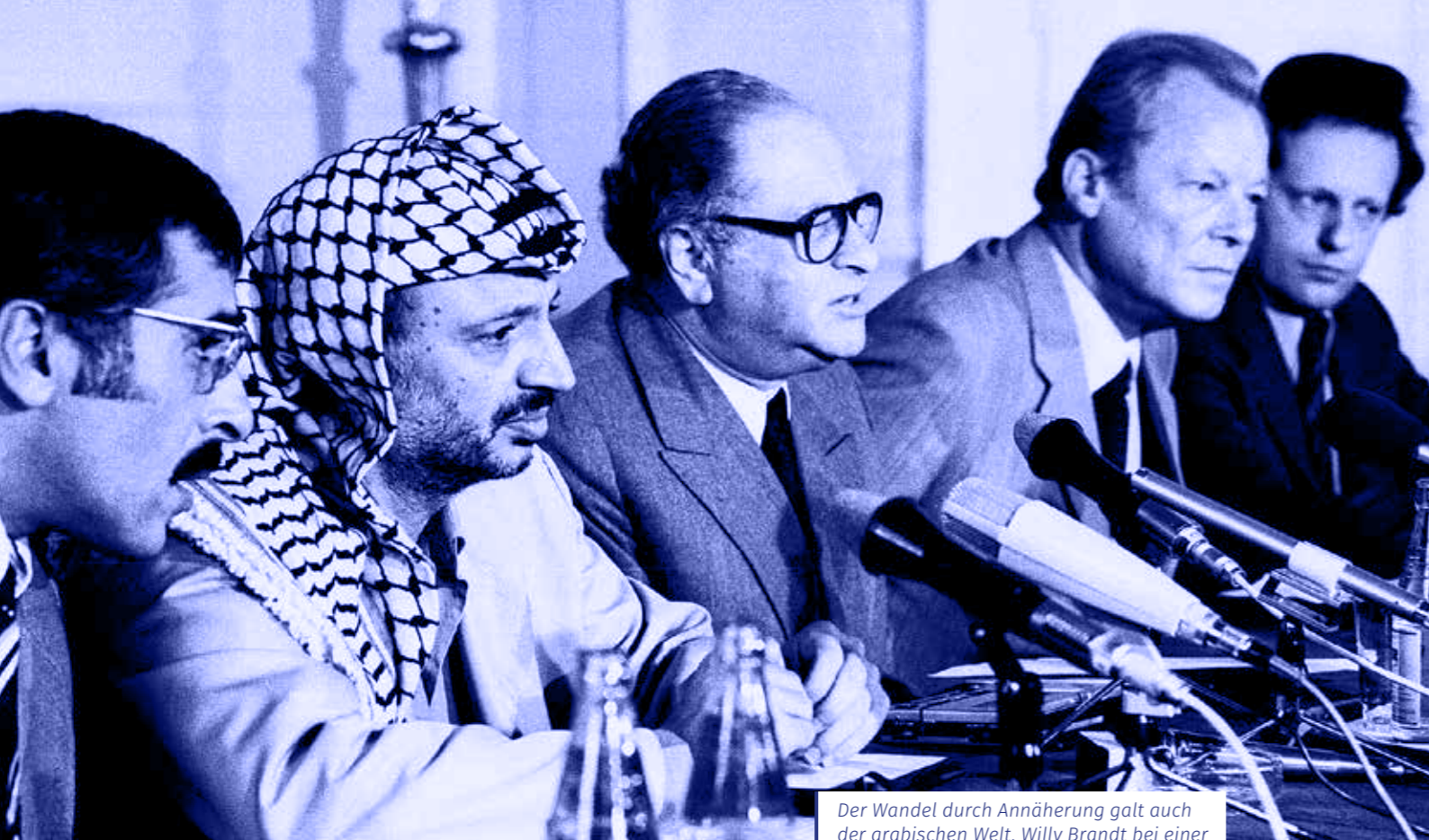
Der Wandel durch Annäherung galt auch der arabischen Welt. Willy Brandt bei einer Pressekonferenz mit Bruno Kreisky und Jassir Arafat 1979.