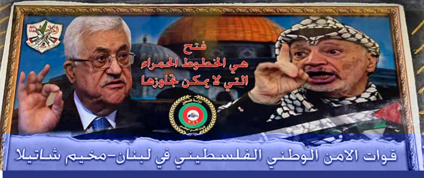
Poster und Wandbilder zeigen die Führer der palästinensischen Parteien. Vielen Palästinensern gelten sie als unfähig und korrupt.