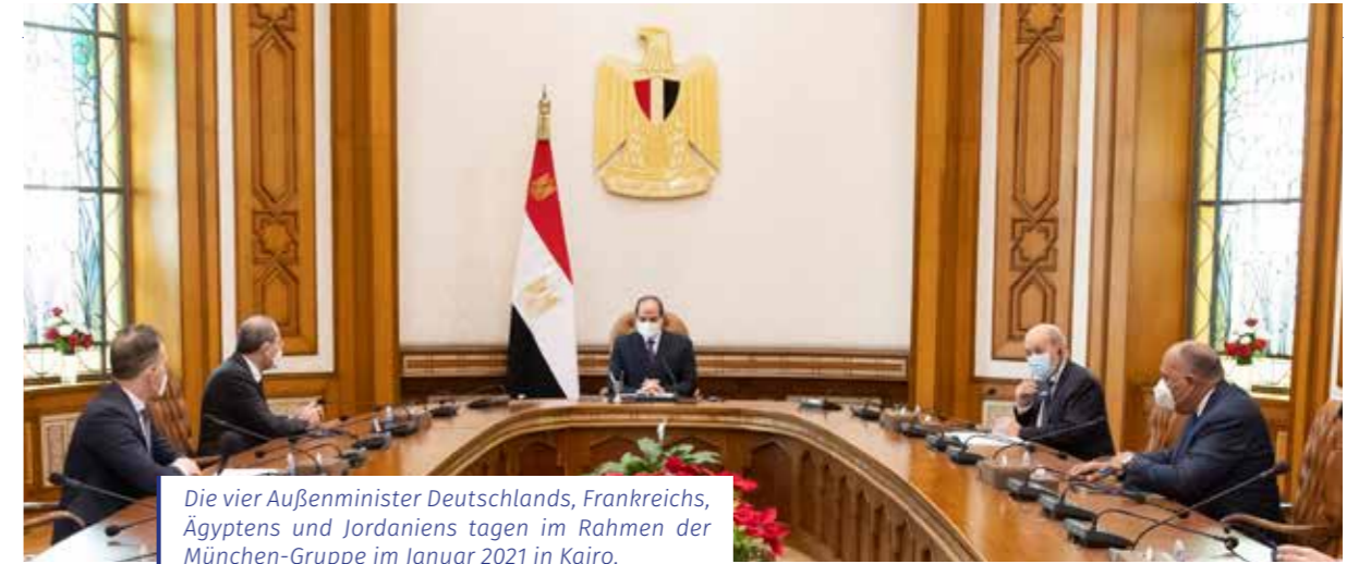
Die vier Außenminister Deutschlands, Frankreichs, Ägyptens und Jordaniens tagen im Rahmen der München-Gruppe im Januar 2021 in Kairo.

nensischen Arabern in das israelische Kernland für die Bundesrepublik nicht akzeptabel ist und man auf eine konsequent friedensfördernde Verwendung der Gelder besteht.