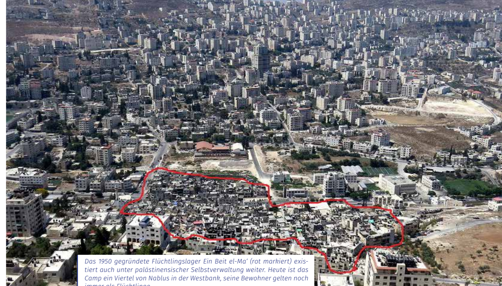
Das 1950 gegründete Flüchtlingslager Ein Beit el-Ma' (rot markiert) existiert auch unter palästinensischer Selbstverwaltung weiter. Heute ist das Camp ein Viertel von Nablus in der Westbank, seine Bewohner gelten noch immer als Flüchtlinge.

Gleichwohl leben heute Millionen von Palästinensern als Flüchtlinge auf palästinensischem Grund und Boden und streben ihre Rückkehr an – in ein Land, in dem sie nie gelebt haben. Und die UNRWA unterstützt sie dabei ausdrücklich. Mit ihrer Hilfe können die Palästinenser an ihrem Vorhaben festhalten, über eine Rückkehr die Demografie in Israel so zu verändern, dass die Juden zur Minderheit würden. Genau das ist auch ein Grund, warum auch die arabischen Staaten das Thema der Rückkehr vor allem anfangs so in den Vordergrund stellten: Auf diesem Wege versuchen sie, zu erreichen, was ihnen im Krieg gegen den jüdischen Staat auf militärischem Weg nicht gelungen war. Der ägyptische Außenminister führte das 1949 in aller Klarheit aus: Wenn die arabischen Staaten eine Rückkehr der Flüchtlinge nach Palästina forderten, dann meinten sie, „dass sie als Beherrscher des Heimatlandes zurückkommen sollen, nicht als Sklaven. Um es noch deutlicher zu sagen: Sie wollen den Staat Israel vernichten. “ 25 Dass keine israelische Regierung – ganz egal, welche Parteien ihr angehören – sich darauf einlassen kann und wird, versteht sich von selbst.