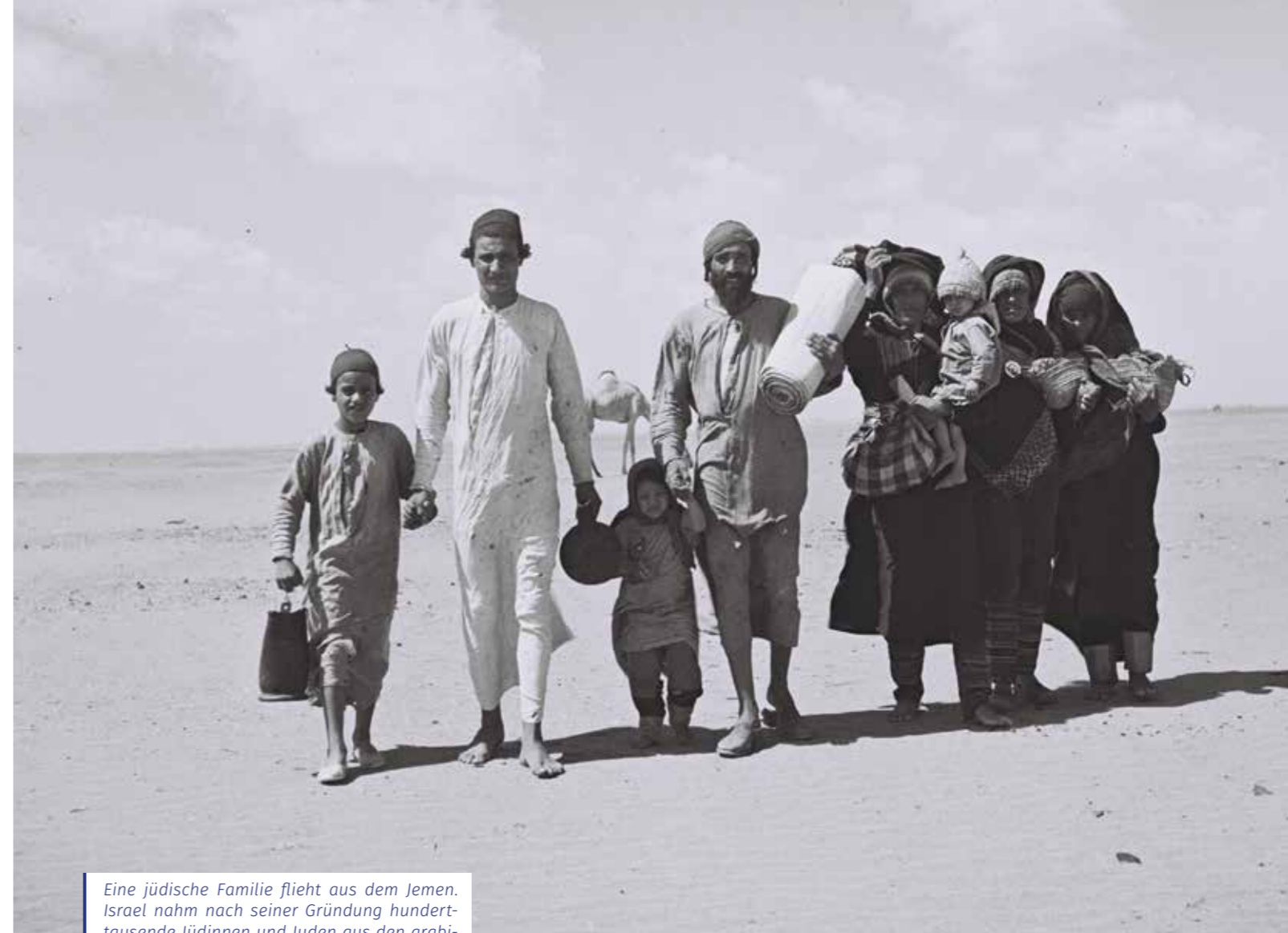
Eine jüdische Familie flieht aus dem Jemen. Israel nahm nach seiner Gründung hunderttausende Jüdinnen und Juden aus den arabischen Ländern und dem Iran auf.

Dazu kam, dass es sich nicht um eine einseitige Fluchtbewegung der Araber handelte, sondern, wenn man auch den Exodus der Juden aus der arabischen Welt berücksichtigt, um eine Art von Bevölkerungsaustausch – ein Umstand, der heute fast in Vergessenheit geraten ist und in den Diskussionen über die Lösung des Flüchtlingsproblems oftmals übersehen wird. Binnen weniger Jahrzehnte hörten im gesamten Nahen Osten und in Nordafrika etliche jüdische Gemeinden zu existieren auf, die es dort seit Hunderten oder – wie im Fall des Irak – gar schon seit Tausenden Jahren gegeben hatte; die noch übrig gebliebenen, schrumpften kontinuierlich dahin. Von den insgesamt rund 820.000 Juden, die ihre Heimatländer verlassen mussten, fanden fast 600.000 in Israel eine neue Heimat.