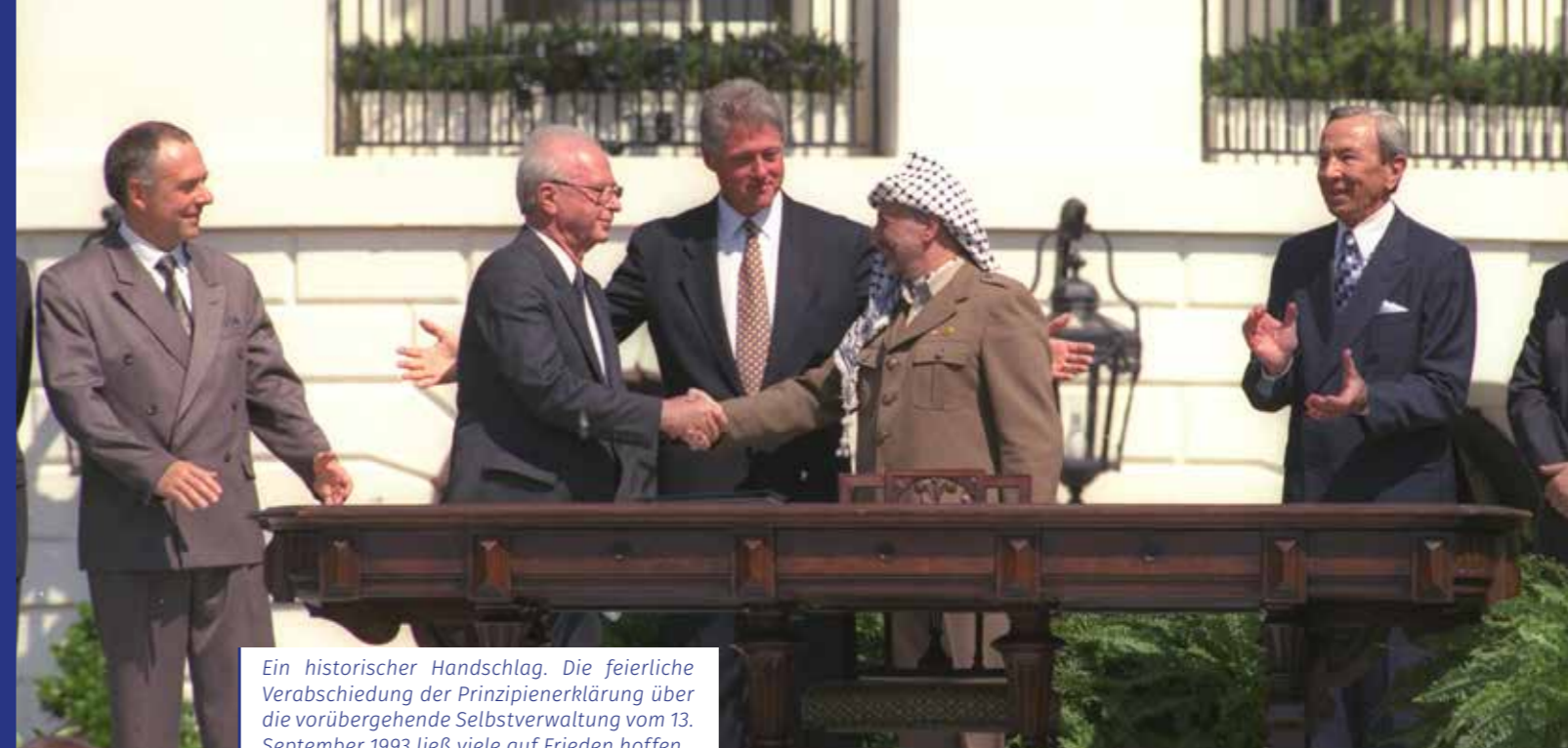
Ein historischer Handschlag. Die feierliche Verabschiedung der Prinzipienklärung über die vorübergehende Selbstverwaltung vom 13. September 1993 ließ viele auf Frieden hoffen.

Der historische Handschlag zwischen dem PLO-Führer Jassir Arafat und dem israelischen Premierminister Jizchak Rabin im Rosengarten des Weißen Hauses ging um die Welt. Kaum eine Zeitung wählte am Folgetag ein anderes Motiv für ihre Titelseite. Für viele schien es damals, als wäre ein finaler Friedensschluss in greifbarer Nähe. Die feierliche Verabschiedung der Prinzipienklärung über die vorübergehende Selbstverwaltung am 13. September 1993 sollte dabei nur der Auftakt einer ganzen Reihe weiterer Vereinbarungen sein. Und tatsächlich kamen zum Vertragswerk am 29. April 1994 das Protokoll über die wirtschaftlichen Beziehungen und kurz darauf das Gaza-Jericho-Abkommen hinzu, bevor Arafat am 1. Juli 1994 aus seinem tunesischen Exil zurückkehrte, um den Aufbau der Palästinensischen Autonomiebehörde voranzubringen.