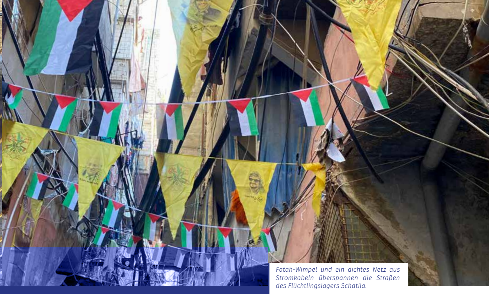
Fatah-Wimpel und ein dichtes Netz aus Stromkabeln überspannen die Straßen des Flüchtlingslagers Schatila.

Sie zeigt mir das Museum der Erinnerungen . Inmitten des Lagers werden hier Gegenstände aufbewahrt, die Flüchtlinge aus ihrer palästinensischen Heimat mitgebracht haben. An der hellbeigen Front ist ein großer silberner Schlüssel befestigt: „Er steht symbolisch für die Türschlüssel unserer Häuser in Palästina, die wir verlassen mussten“, erklärt sie.