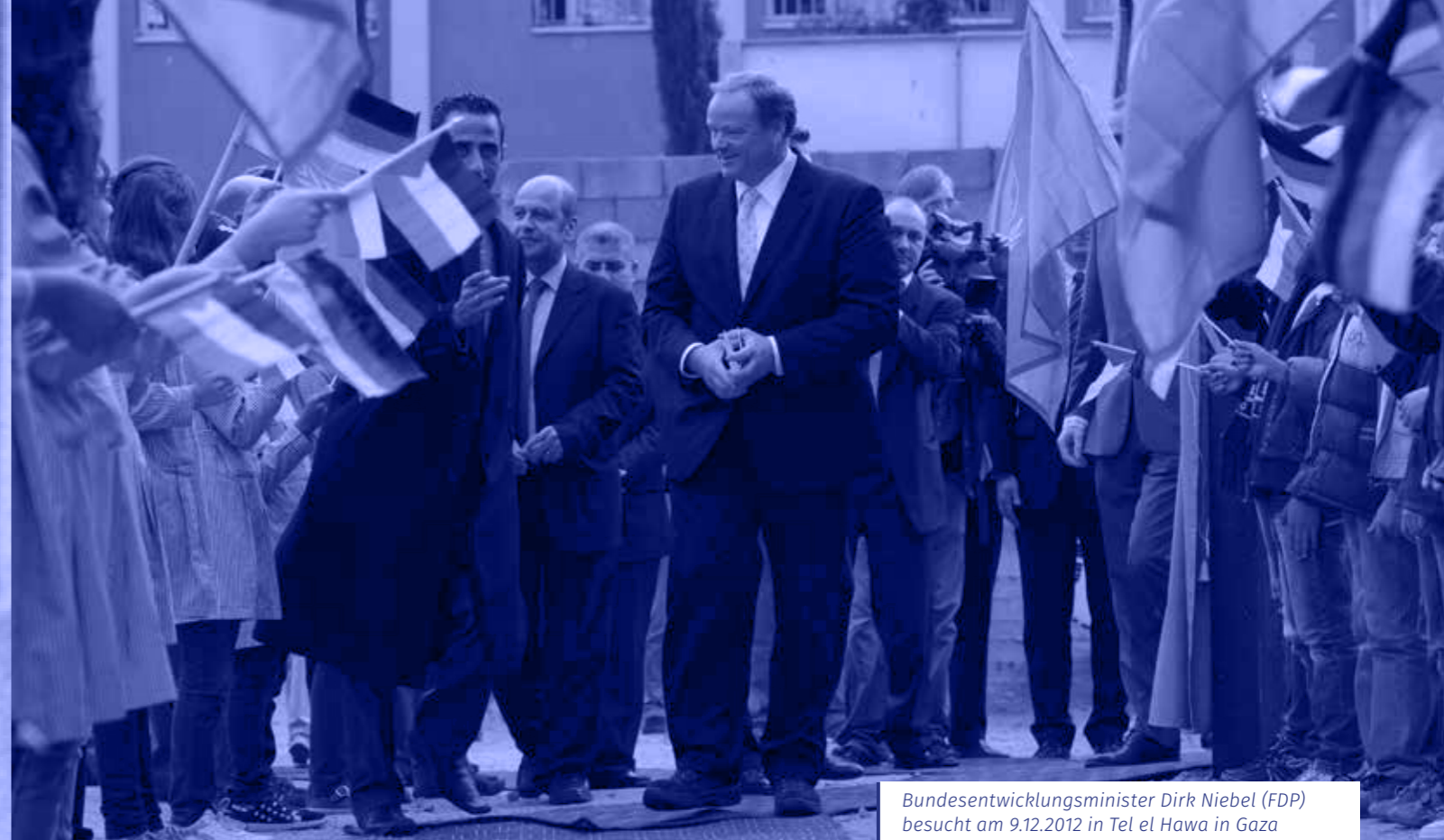
Bundesentwicklungsminister Dirk Niebel (FDP) besucht am 9.12.2012 in Tel el Hawa in Gaza eine in Bau befindliche Grundschule. Die Schule wird mit deutschen Geldern errichtet.

Auf palästinensischer Seite entstand deshalb der Eindruck, dass Terrorismus sich politisch auszahlt und die Bundesrepublik erpressbar sei.