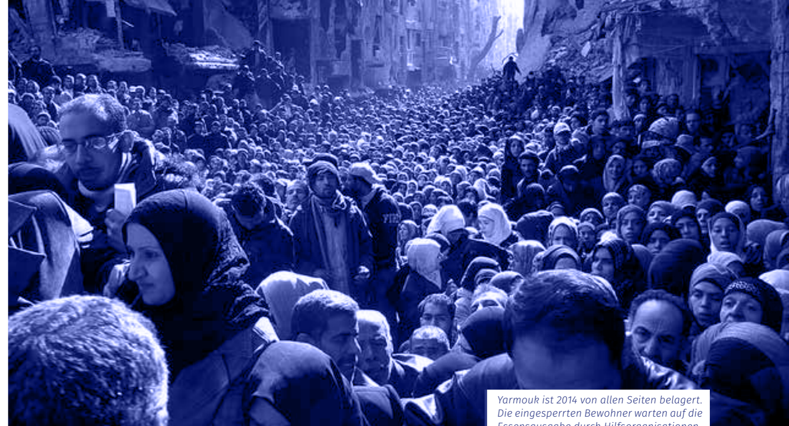
Yarmouk ist 2014 von allen Seiten belagert. Die eingesperrten Bewohner warten auf die Essensausgabe durch Hilfsorganisationen.