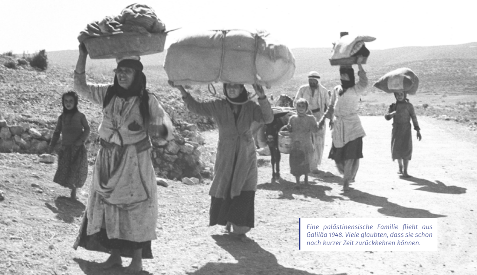
Eine palästinensische Familie flieht aus Galiläa 1948. Viele glaubten, dass sie schon nach kurzer Zeit zurückkehren können.