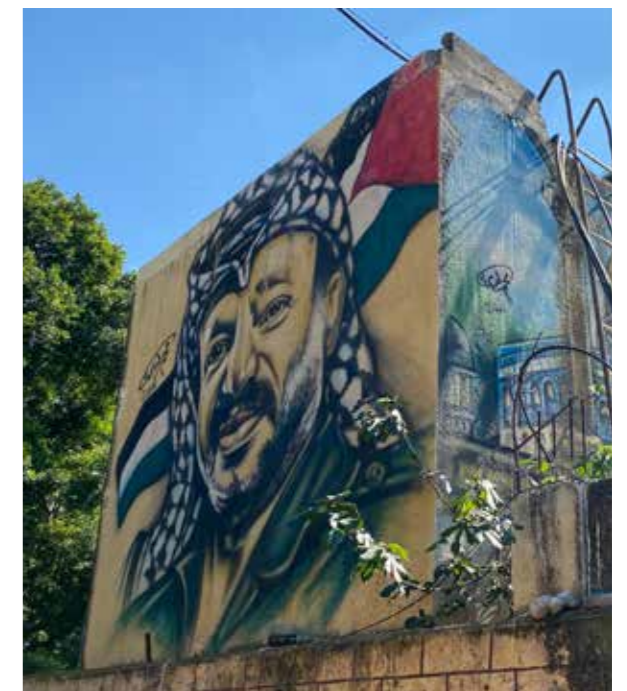
Noch immer scheint das Arafatgraffito die Rückkehr zu versprechen. Von den jungen Palästinensern im Libanon glaubt kaum noch jemand daran.