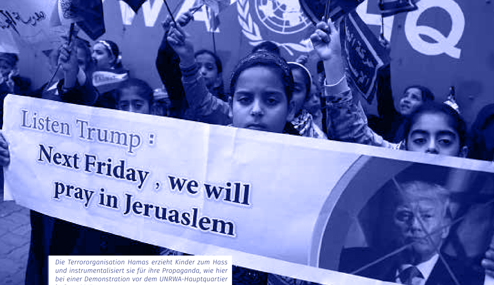
Die Terrororganisation Hamas erzieht Kinder zum Hass und instrumentalisiert sie für ihre Propaganda, wie hier bei einer Demonstration vor dem UNRWA-Hauptquartier in Gaza 2017.

Die Bundesregierung erteilt dieser Forderung also nicht per se eine Absage, sondern hält sie – wenn auch verhandelbar – offenkundig nicht für unangemessen. Die rhetorische Frage des Ex-Kulturstaatsministers Michael Naumann in einem kürzlichen Spiegel-Streitgespräch, wer denn „diesen Unsinn vom Rückkehrrecht [...]“ ernst nehme, 8 lässt sich also eindeutig beantworten: Nämlich u.a. die Bundesregierung. Und das beweist sie immer wieder. Erst im Januar diesen Jahres wurde auf einem Treffen der vier Außenminister Ägyptens, Jordaniens, Frankreichs und Deutschlands im Rahmen der sogenannten München-Gruppe der Rückzug Israels hinter die sogenannte 67er Grüne Linie gefordert. Diese irritierende Forderung fällt hinter die Positionen der Camp David-Gespräche zurück, in denen bereits ein weitreichender territorialer Ausgleich auf dem Tisch lag (vgl. S. 20-27). Die vier Außenminister verstanden das Treffen zudem als Bekenntnis zu den Parametern der saudischen Friedensinitiative von 2002, in der ein Rückkehrrecht der Palästinenser nicht ausgeschlossen bzw. eine verbindliche Integration in die arabischen Fluchtzielländer nicht