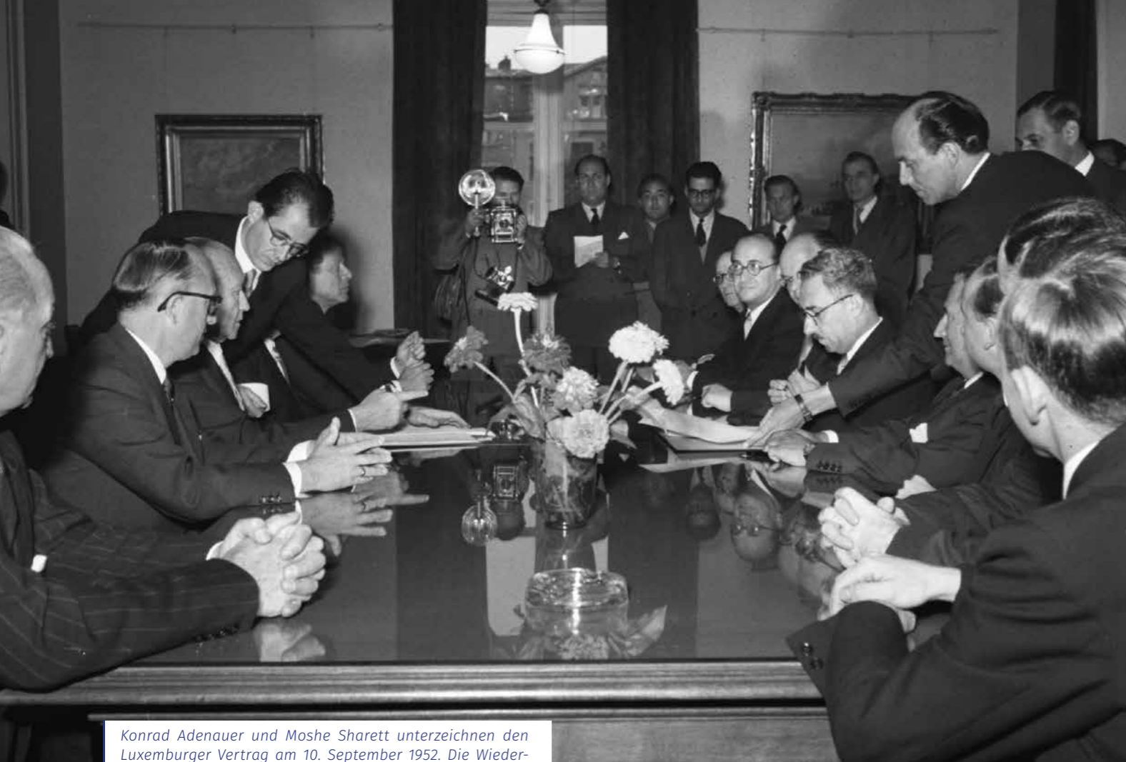
Konrad Adenauer und Moshe Sharett unterzeichnen den Luxemburger Vertrag am 10. September 1952. Die Wiedergutmachungsverhandlungen mit Israel waren von heftigen arabischen Protesten begleitet.

Der deutsche Botschafter in Ägypten berichtete im April 1953, dass es keinen „konstruktiven Plan zur Lösung des Flüchtlingsproblems“ gebe. „Es hat den Anschein“, schrieb er, „dass den arabischen Staaten hieran nicht gelegen ist. Sie ziehen es vor, diese Wunde weiterhin offen zu halten, um auf die Westmächte und auf Israel einen dauernden Druck ausüben zu können.“ 7 Ähnlich berichtete der deutsche Gesandte aus dem Libanon: „Der libanesische Staat beteiligt sich nicht an der Unterstützung der Flüchtlinge und gewährt diesen keinerlei Hilfe, um sie in die libanesische Wirtschaft einzugliedern.“ Die UNRWA stünde dagegen für einen konstruktiveren Kurs, denn ihre Mitarbeiter wollten „eine Lösung des Problems durch eine aktive Mitarbeit der arabischen Staaten zur Ansiedelung der Flüchtlinge auf neu zu erschließenden Gebieten“ erreichen. 8